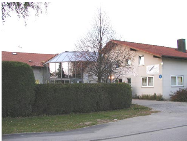
Blick auf die Firmeneinfahrt