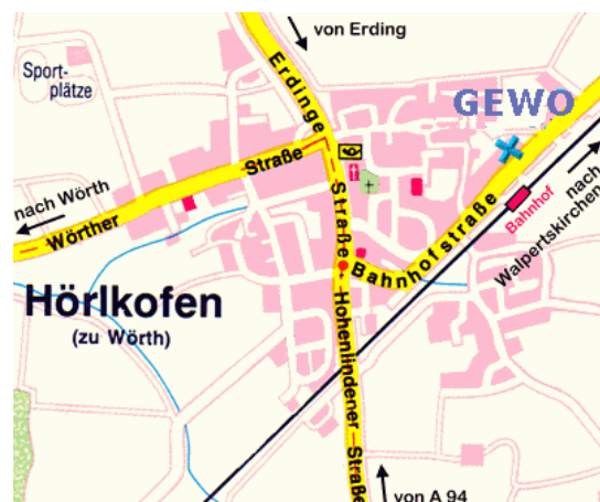
Stadtplan von Hörlkofen